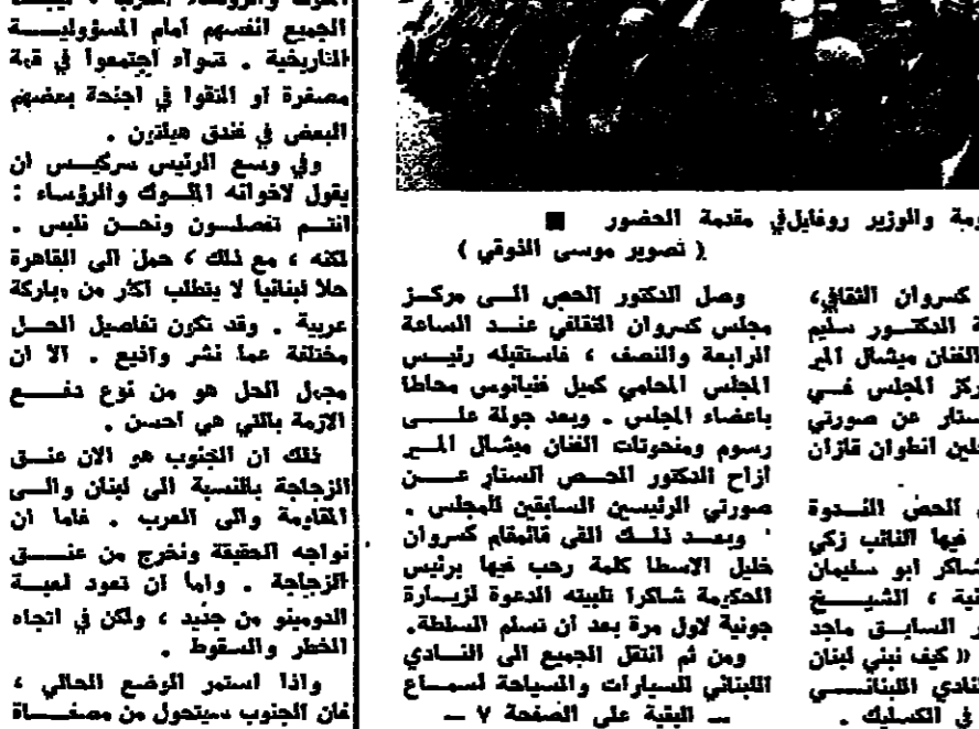
الجميل، حمادة، مزودي، وابو سليمان خلال القادة